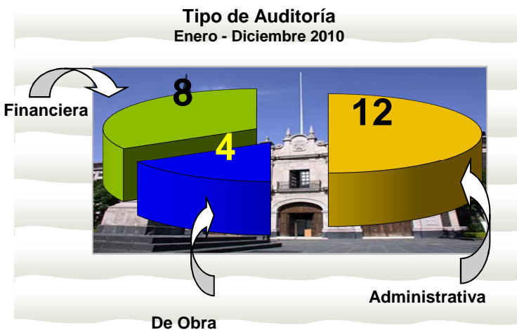
Acciones de Fiscalización Enero - Diciembre 2010